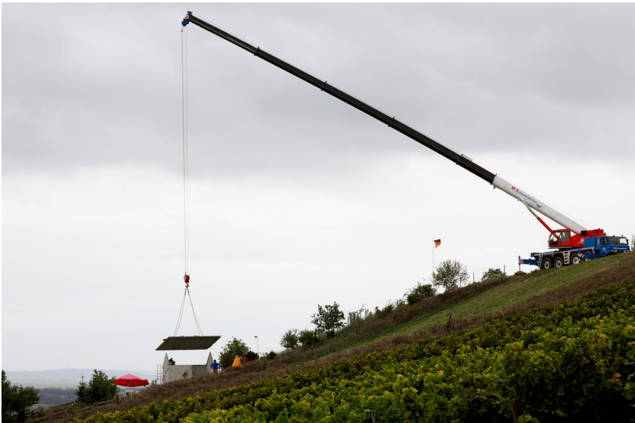
Einheben des ersten Dachelements