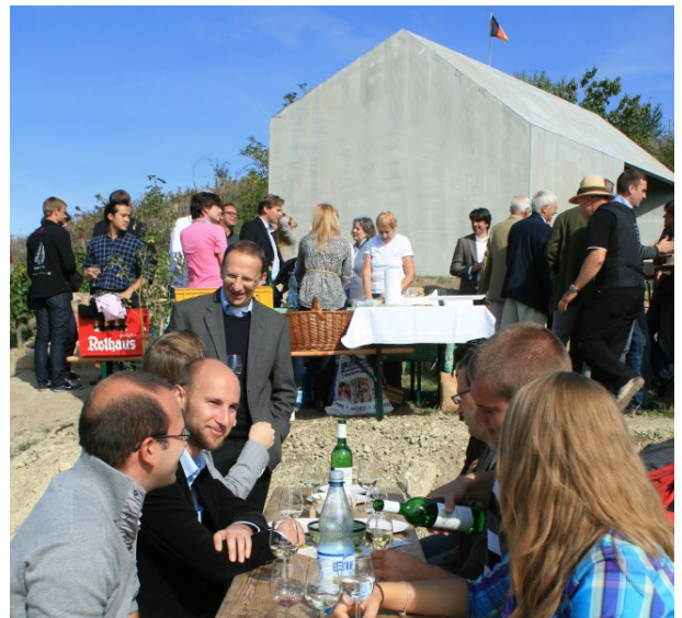
Einweihungsfeier am 23. September 2011