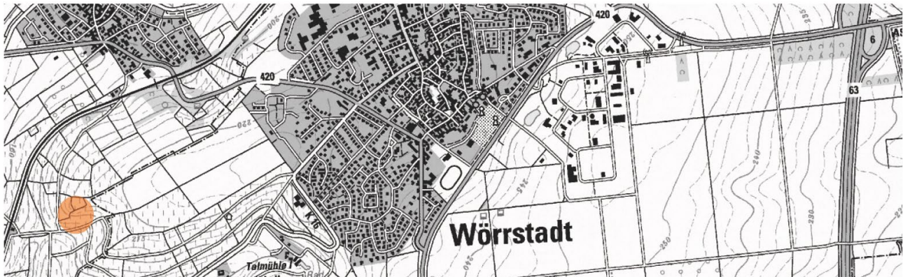
Lageplan des Weinberghauses

Das Thema Weinberghaus wurde 2009 in einem Entwurfsseminar im Studiengang Architektur aufgegriffen. Die Frage war, wie sich dieser Bautyp, dessen Ursprung im Mittelmeerraum liegt und der sich auch schon seit Langem in der Pfalz findet, in eine zeitgemäße Konstruktion und Form übertragen lässt, ohne in weinselige Klischees zu verfallen.