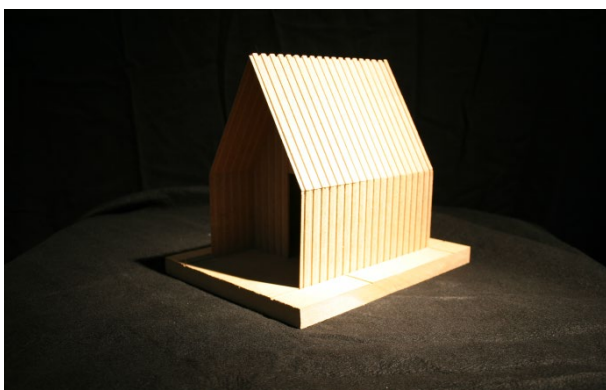
Modelle der drei ausgewählten Entwürfe