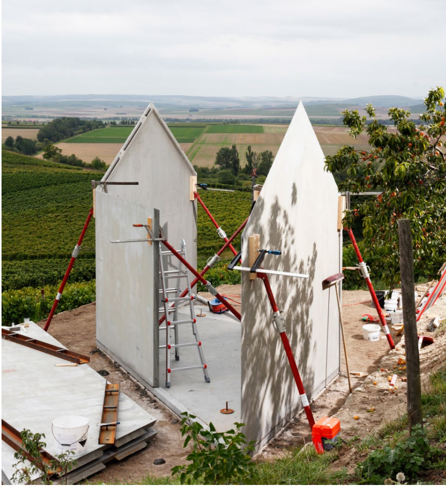
Bauzustand vor dem Aufsetzen der Dachelemente