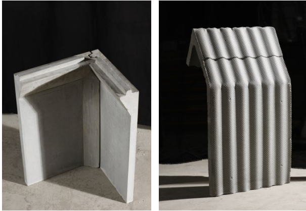
Musterstücke im Originalmaßstab

In einem weiteren Schritt wurden von jedem der drei Entwürfe Musterstücke im Originalmaßstab hergestellt. Um bei den angestrebten möglichst filigranen Bauteildicken (wenige Zentimeter) ein duktileres Tragverhalten sicherzustellen, wurde eine sogenannte Mikrobewehrung ausgewählt. Sie besteht aus mehreren Lagen Drahtgittermatten mit einer Maschenweite von rund einem Zentimeter und Stahldrähten mit einem Durchmesser von rund einem Millimeter.