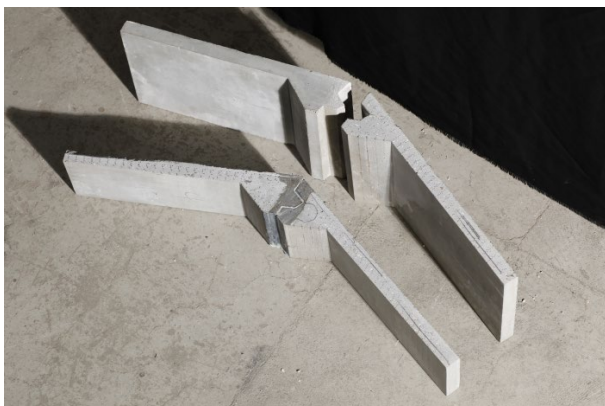
Musterstücke des Nut- und Federsystems

Letztlich wurde Christoph Perkas Entwurf ausgewählt. Er sieht sieben Fertigteile vor: eine nichttragende Bodenplatte, die auf die tragende Ortbetonbodenplatte aufgelegt wird, zwei Giebelelemente, zwei Wandelemente und zwei Dachelemente. Alle Elemente haben umlaufende aufgedickte Ränder, die als Nut- und Federsystem ausgebildet sind, welches die Elemente miteinander verbindet. Die Besonderheiten an dem Entwurf sind zum einen, dass durch die geschickte Anordnung der Nuten und Federn in den Fugen keine Zugkräfte übertragen werden müssen, wodurch keine „Klebewirkung“ notwendig ist und zum anderen, dass die beiden Giebelelemente, die beiden Wandelemente und die beiden Dachelemente jeweils genau die gleiche Geometrie haben. Dies macht jeweils nur eine Schalung erforderlich. Der rautenförmige Grundriss hat eine Länge von rund 7,5 m und eine Breite von 2,5 m. Die Firsthöhe liegt bei 3,4 m.